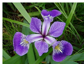
Fleur d'iris (Wikipédia)